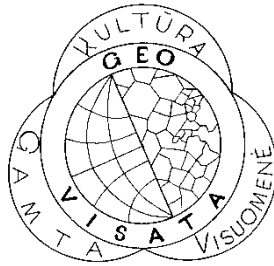
1 pav. Geovisata ir jos kontekstai

Turim ir humanitarinę, ir humanistinę geografiją (Yi Fu Tuan'o topofilija, artima mūsų A. Šliogerio filotopijai) bei plačią kultūrų geografiją. Geografai vis mėgsta pasigirti, kad jų dalykas yra labiausiai integruotas. Bet, kaip teko pastabėti, tai žeidžia kitus dalykininkus. Fizikai, biologai, ar istorikai bei filologai, reikia manyti, kad ir matematikai, rastų argumentų, kad jų dalykai irgi yra integruoti. Užsienio autoriai geografiją dažnai įvardina kaip hibridinį dalyką / mokslą. Geografija visada siekė būti tiltu tarp gamtos, socialinių ir humanitarinių mokslų. Mokyklų ugdymo planuose irgi rasim didelę įvairovę: vienur geografija priskirta prie gamtos / aplinkos mokslų (Suomija), kitur prie socialinių (JAV) arba menų ir humanitarinių (Australija). Šiandien mokslai ir dalykai pereina į transdisciplininių ir sinergetinių ryšių lygmenį (2 (a), (b) pav.).